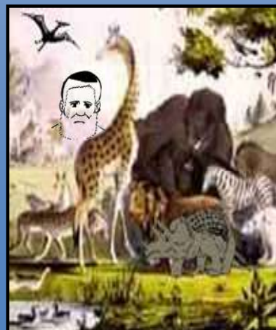
Day 6 - יום שישי