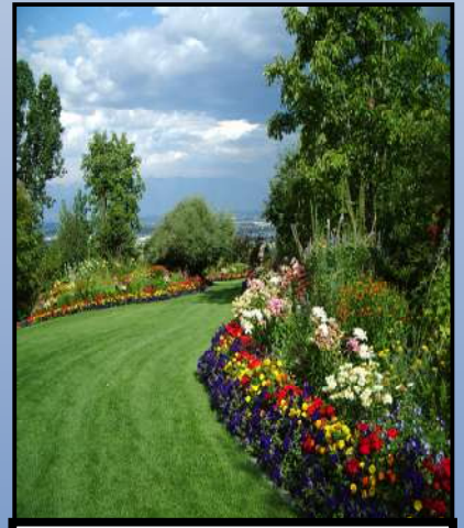
Day 3 - יום שלישי