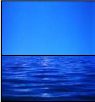
Day 2 - יום שני