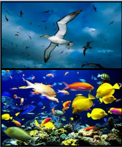
Day 5 - יום חמישי