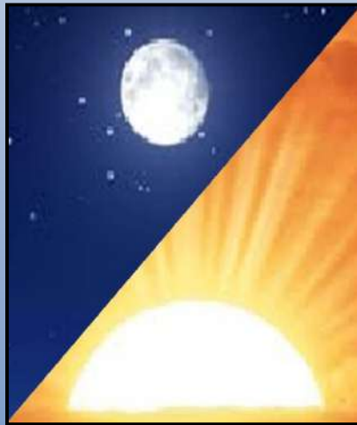
Day 4 - יום רביעי