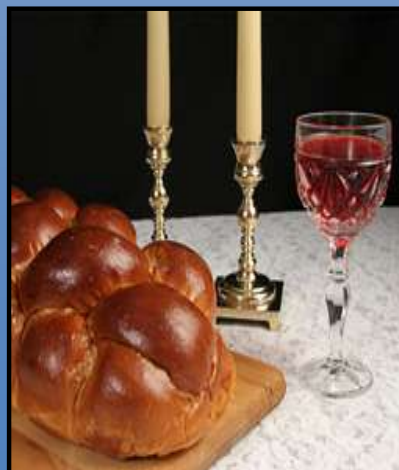
Day 7 - יום השביעי